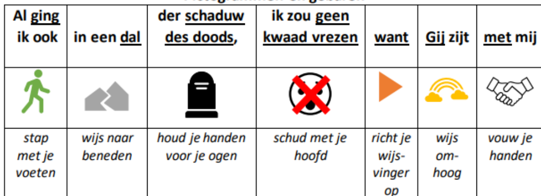
Pictogrammen en gebaren

Ruzie- boosheid -Ik zorg voor je - lelijke woorden – roddelen –Ik help je - slaan-Ik troost je – schoppen – ziekte –Ik vergeef je – zorgen- ongehoorzaam — –Ik ben bij je